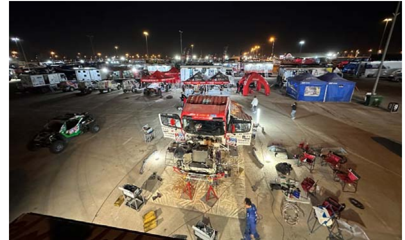
休息日の日が暮れましたが整備は続きます。