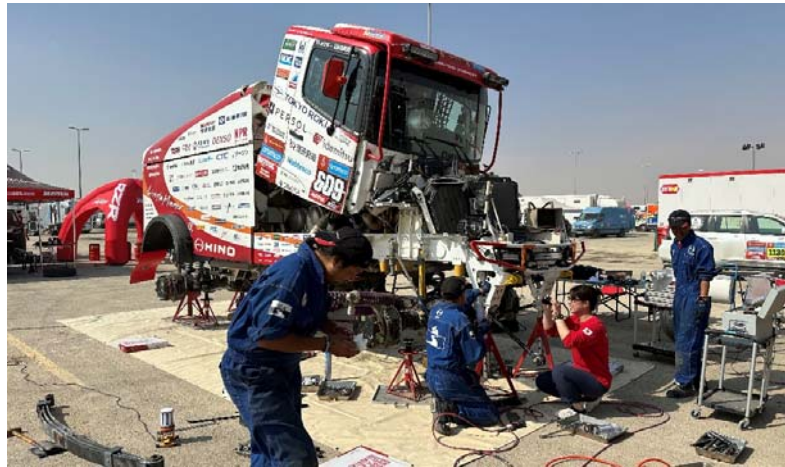
久々の昼間の整備、見やすいし暖かくて作業しやすいです。

今大会の最大の山場と言える48時間クロノステージ(2日かけて砂丘の難所をメカニックの整備無しで走り切らねばならない)から燃料トラブルを抱えながらも無事帰還し、折り返しを迎えています。中間休息日の13日の朝から、メカニック達は車の整備に取り掛かっていきます。インテイクオーターでの燃料トラブルは少しヒヤッとしましたが、後半戦に向けてしっかり整備して必ずゴールさせます！と力強く語ってくれたメカニック達。後半戦に向けて、チーム一丸となり最高の笑顔でゴールできるように頑張ります！