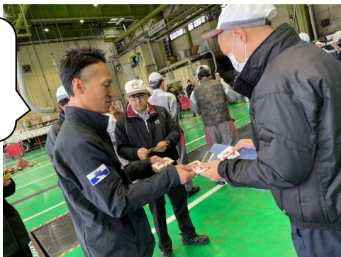
ノベルティのステッカーを一人一人手渡しし、意気込みを兼ねた挨拶をしました。