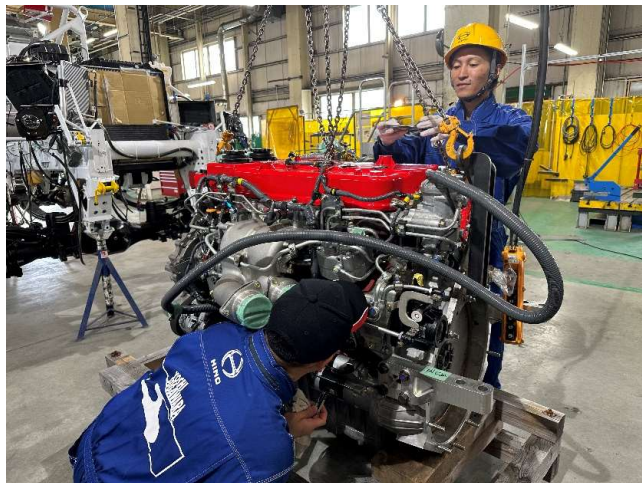
介納入されたレース用エンジン。搭載前の前準備をします。

【販売会社メカニック日記 vol.9】 エンジンの単体ベンチテストが終了し、ついエンジンを車両へ搭載します。 エンジンが搭載されると、キャブが載り、その他の部品取り付けが一気に進みます。